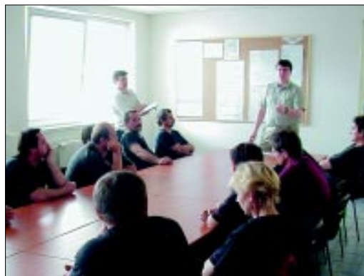
Stretnutie pracovníkov vulkanizácie s prevádzkovým manažmentom.

uvedenom rozsahu absentovali, nás utvrdili v tom, že pracovníci majú o nezáujem. Veríme, že sa budú aj naďalej aktívne zapájať do procesu zlepšovania nielen komunikácie, ale aj problematiky celého výrobného procesu.