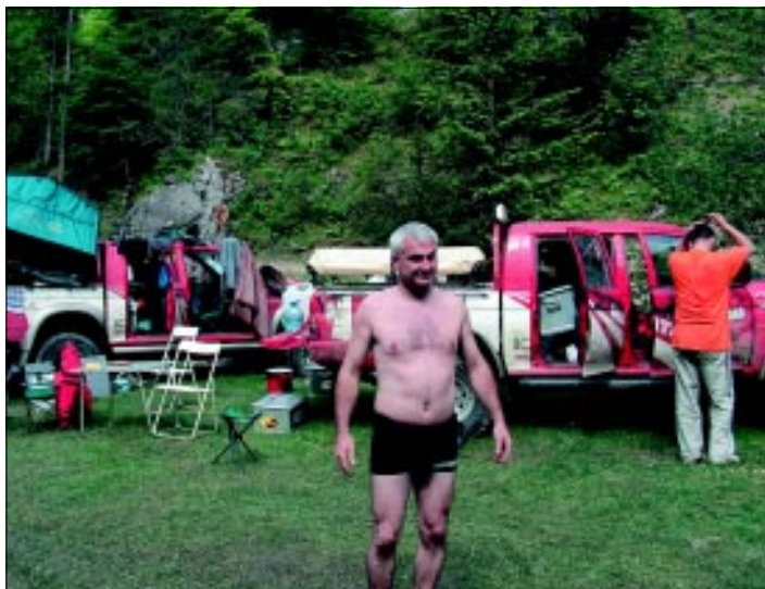
Krásne slnečné ráno sme využili aj na dosušenie vecí, ktoré deň predtým nemilosrdne zmáčal hustý dážď.