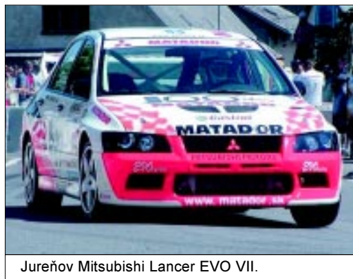
Jureňov Mitsubishi Lancer EVO VII.

o európske body. Pretek pozostával z troch tréningových a troch ostrých jazd. Jureňov tím mal po