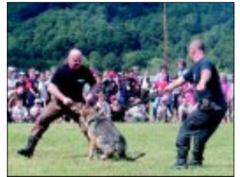
Ukážku výcviku policajných psov deti pozorovali so záujmom a hlavne z bezpečnej vzdialenosti.