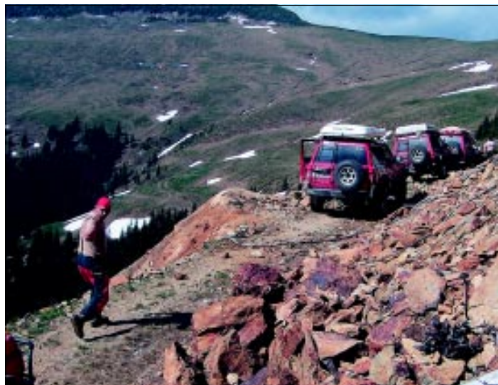
Podkladanie skál a spevňovanie povrchu bolo pravidelným rituálom pri náročnej ceste k vytúženému vrcholu.