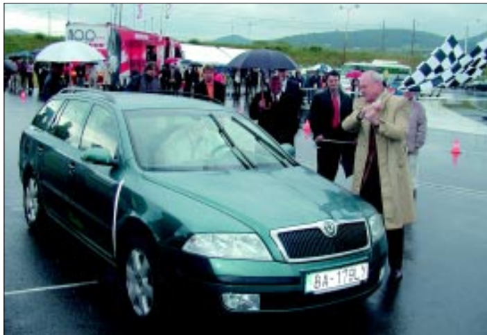
Prvého jazdca odmäval prezident SR Ivan Gašparovič, ktorý si na všeobecné sklamanie za volant súťažného auta nesadol.