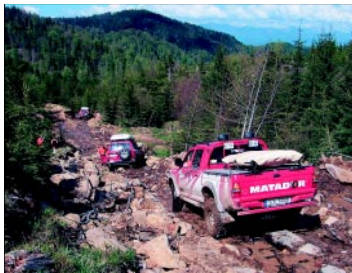
Presuny sme často absolvovali cez svoje rumunské horské „dialnice“, ktorých základ tvorili kamene.