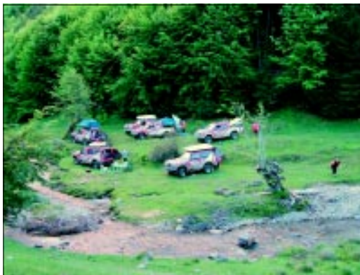
V základnom tábore to pri pohľade zvrchu vyzeralo ako v paddocku pri off roadových pretekoch.