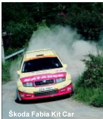
Škoda Fabia Kit Car