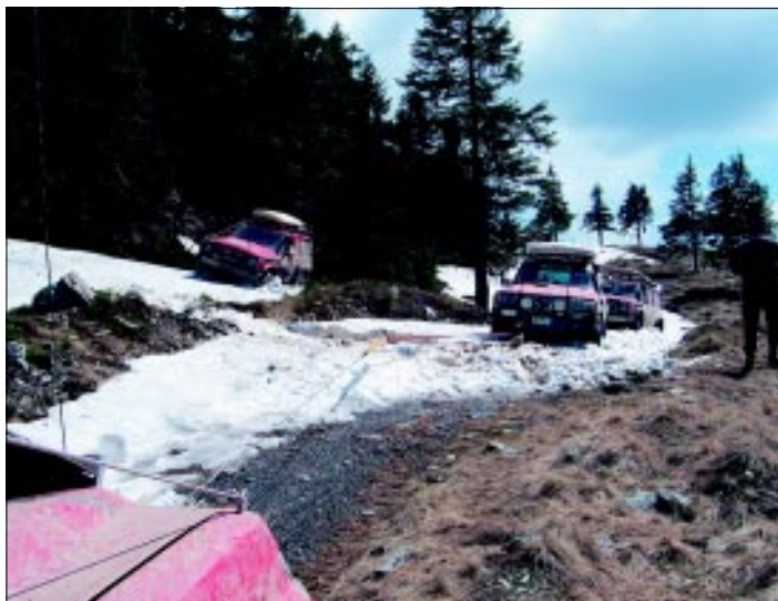
V pásme kosodreviny vo výške 1 600 m n. m. sa objavil prvý sneh, čo vytváralo nádherný kontrast so slnečným dňom.