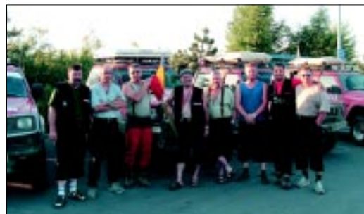
...vidina teplej večere bola pre nás mimoriadne silná pri príjazde do Ostravy. Napriek únave sme sa radi podelili s divákmi a novinármi o bezprostredné zážitky z expedície Dracula Matador.