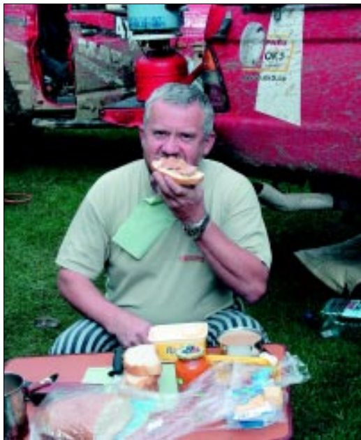
Posledné „draculovské“ raňajky v Rumunsku...