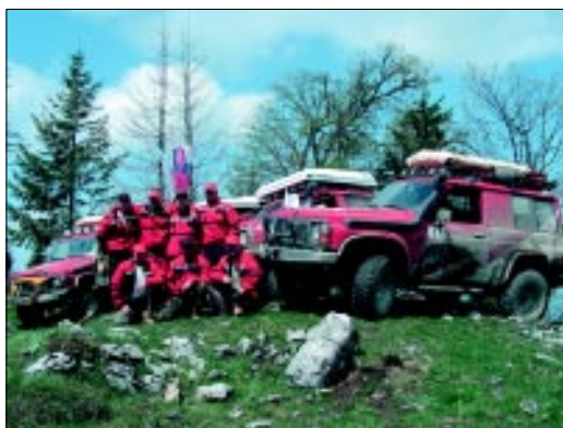
Konečne sme sa dočkali! Po strastiplnej ceste sme si dopriali zaslúžený oddych a spoločnú fotku v cieľi.

Prebúdame sa do posledného off roadového dňa a všetkým je nám tak nejako divne smutno... všetci už vieme, že dnešný deň bude naším posledným v teréne. Napriek tomu, že už sme aj značne unavení, zarastení a nie vždy dokonale umytí, predsa sa nám len